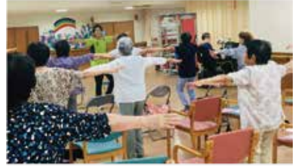
▲EMI笑活で体操指導中のひとコマ

地域の皆さんが笑みの多い明日を紡いでいけるように、これからも地域で活躍されている包括支援センターや民生委員の方々とより連携を図っていければと思っております。