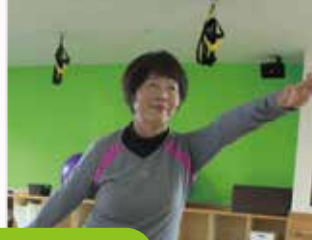
週1回ご利用のスーパーマン